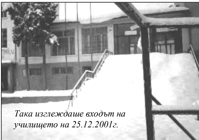
Така изглеждаше входът на училището на 25.12.2001г.

-Причините, поради които коледната ваканция започна преждевременно и завърши няколко дни след "регламентираното" ѝ време, са няколко. Основната причина е в ниските температури през декември и януари. Такива ниски стойности не са запомнени от дълго време в нашия град. Те неизбежно повлияха на микроклимата в класните стаи. Със заповед от началника на ХЕИ прекъснахме учебния процес. До